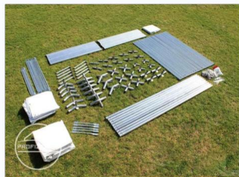
Abb. kann in Größe und Farbe abweichen